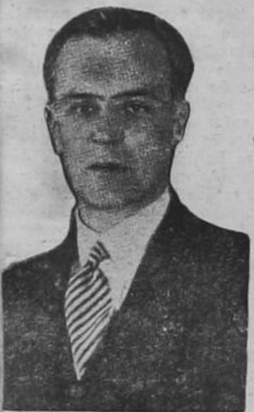
GRIGORE GAFENCU Ministro de Relaciones Exteriores de Rumania

PARIS, 2. UP. — Violentos duelos de ametralladoras entre las casamatas francesas y alemanas en el sector del Rin ha sido la única actividad registrada en el frente en las últimas horas. Los duelos de artillería se han limitado a salva esporádicas.